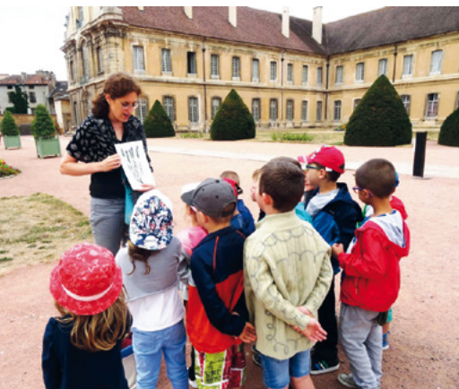
Observer l'architecture ...