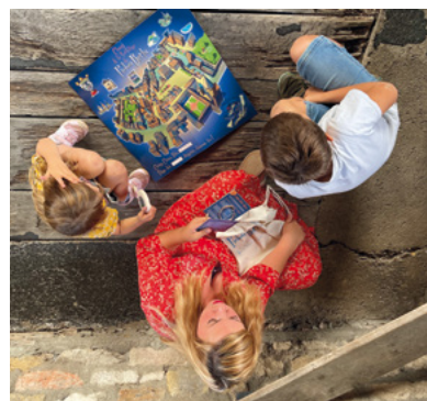
Oser l'aventure ...