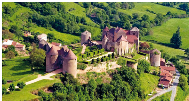
Rêver d'être un chevalier ...