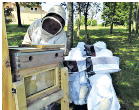
Découvrir le monde du vivant..