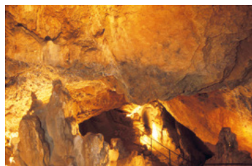
Explorer la vie souterraine ...