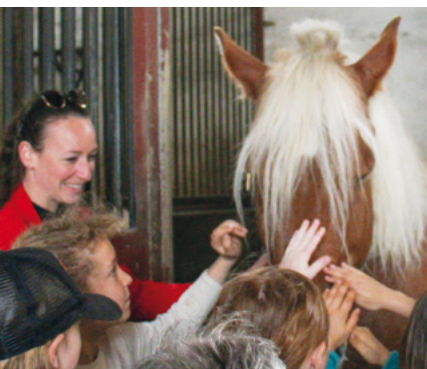
S'imaginer cavalier ...